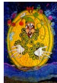
EL LOCO THE FOOL